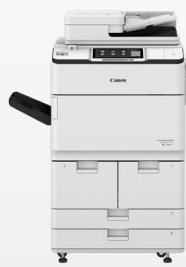
iR ADV DX 6700

Nos méthodes de travail évoluent de manière significative, tout comme nos besoins en matière de périphériques d'impression et de numérisation.