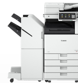
iR ADV DX C3700