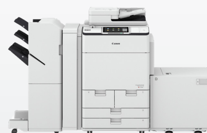
iR ADV DX C7700