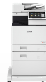
iR ADV DX C477