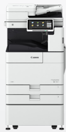
iR ADV DX 4700