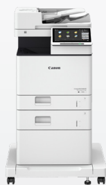
iR ADV DX 717/617/527