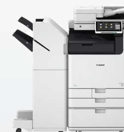
iR ADV DX C5800